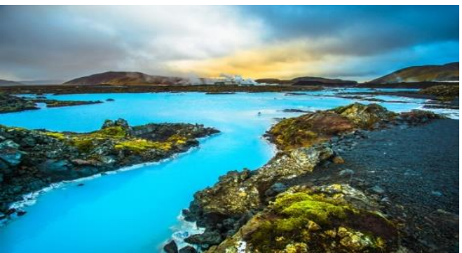
เป็นเขตอนุรักษ์ธรรมชาติที่ปลายคาบสมุทรเซลต์ยาร์นาร์เนส

(พิเศษ...ทาง บลู ลากูน ได้จัดเตรียมอุปกรณ์ในการเข้าใช้บริการไว้ให้เรียบร้อยแล้ว อาทิ ครีมทาผิว, รองเท้าแตะ และผ้าขนหนู ให้ท่านมีเวลาผ่อนคลายกับการแช่น้ำแร่อย่างจุใจ)