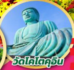
วัดโคโตคุชิน