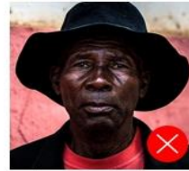
Back side is colored