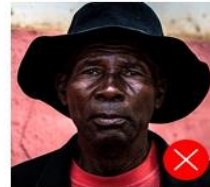
Back side is colored