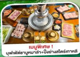
เมนูพิเศษ! บุฟเฟ่ต์ชาบูหม่าล่า+บิงย่างสโตร์เกาหลี