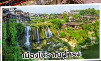
เมืองโบราณฟูหรง