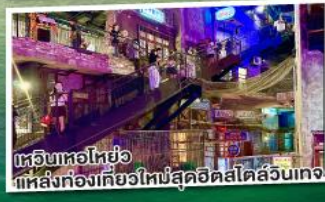
เทรนด์แฟชั่นไฮโซ แหล่งช้อปปิ้งไฮโซสุดฮิตสไตล์ฉางซา