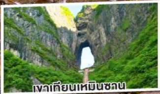
เงาเทียนเหมินชวน