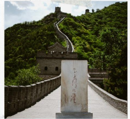
กำแพงเมืองจีน ด่านจวิหยงกวน