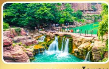
อุทยานหยุ่นโกซ่าน