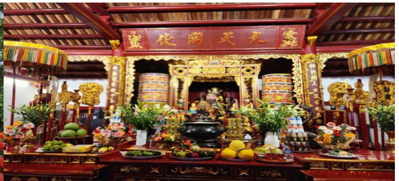
GO1CNXHAN-FD002 ไปแล้วกันเตอะ บินตรง...เชียงใหม่ เวียดนามเหนือ ฮานอย ฮาลอง นิงห์บิงห์ 4 วัน 3 คืน (FD)