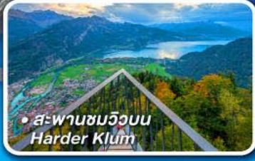
• สะพานชมวิวมบ Harder Klum