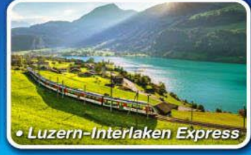
• Luzern-Interlaken Express