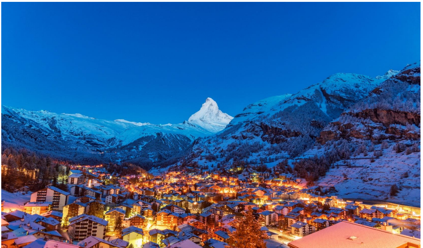
คำ อิสระอาหารค่ำตามอัธยาศัย

สมควรแก่เวลานำท่านเดินทางสู่เมืองทาส Tasch เพื่อนำท่านนั่งรถไฟชัตเติลเข้าสู่เซอร์แมท Zermatt เมืองแห่งสกีรีสอร์ท ยอดนิคมที่ได้รับความนิยมสูง เนื่องจากเป็นเมืองที่ปลอดมลพิษทางอากาศเพราะ ยานพาหนะในเมืองไม่ใช้น้ำมันเชื้อเพลิง แต่ใช้แบตเตอรี่เท่านั้น และยังมีฉากหลังของตัวเมืองเป็นยอด เขาแมทเทอร์ฮอร์น (Matterhorn) ที่ได้ชื่อว่าเป็นยอดเขาที่มีรูปทรงสวยที่สุดในสวิตเซอร์แลนด์