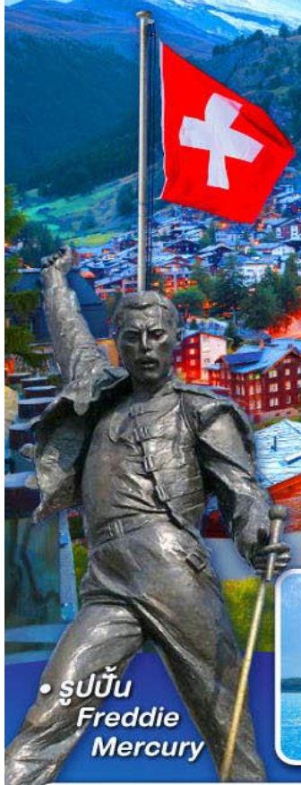
• รูปปั้น Freddie Mercury

พีชิต 5 เจริทิ, เชาฮาร์เคอร์คุม, เชาจุงเฟรา เวกาลาเชียร์ 3000 และ เชากรอนเนือร์เกรต