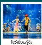
ไห่ซัวซันกู่จิง