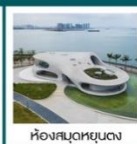
ห้องสมุดหยุนตง