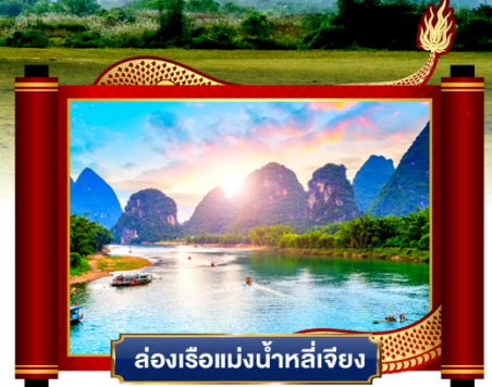
ล่องเรือแม่น้ำหลี่เจียง