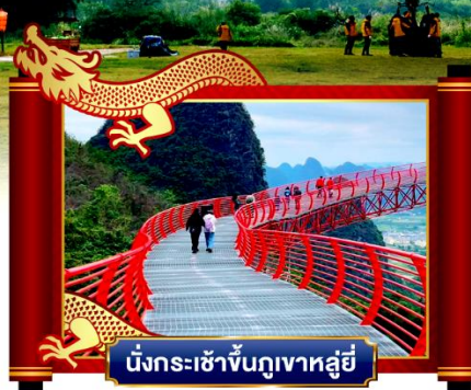
นั่งกระเช้าขึ้นภูเขาหลุยี่