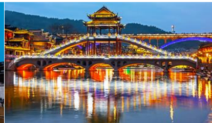
สะพานหวงเจียว