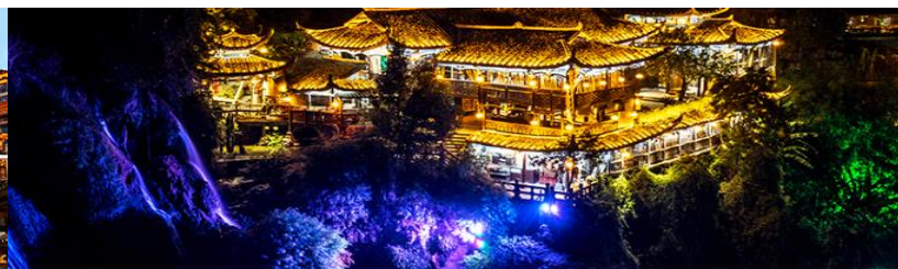
เมืองโบราณฟูหมิงจัน