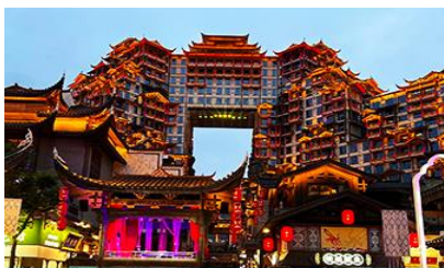
ตึกมหิศวรรษย์ 72 ชั้น

พักที่ YICHANG MELJI BOYUE HOTEL โรงแรมระดับ 4 ดาวหรือเทียบเท่าในเมืองหยี่ชัง