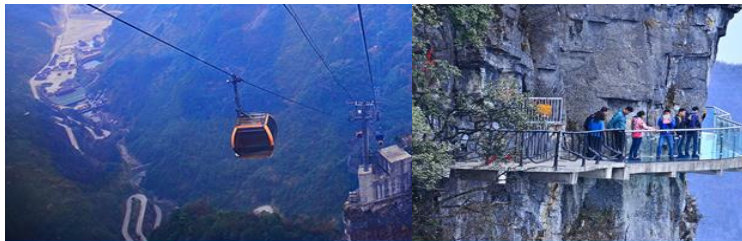
กระเช้าขึ้นเทียนเหมินชาน

โรงแรมระดับ 4 ดาวท้องถิ่นหรือเทียบเท่าในเมืองฟงหวง