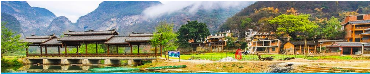
สวนดอกท้อ