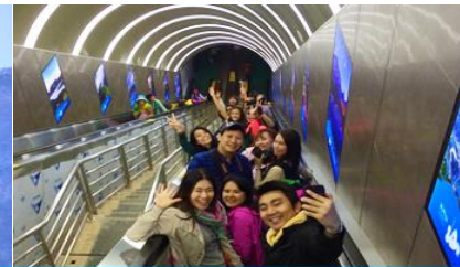
บันไดเลื่อนทะเลภูเขา