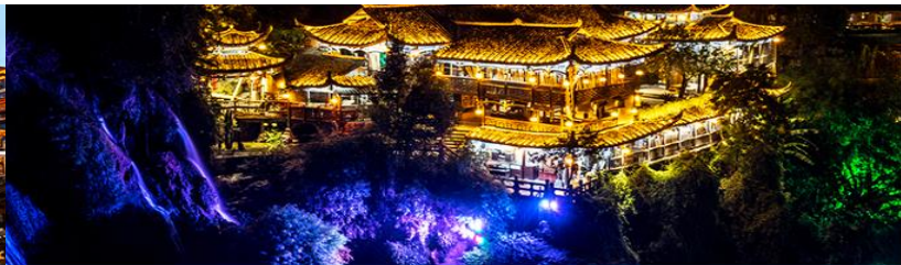
เมืองโบราณฟูหรงจิ้น

วันที่สาม เมืองหยี่ซาง – เมืองจางเจียเจี๋ย – ตึกมหัศจรรย์ 72 ชั้น-ศูนย์แพทย์แผนจีน – เมืองโบราณฟูหรงจิ้น