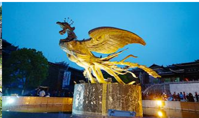
เมืองโบราณฟ่งหวง