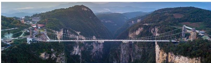
สะพานกระจกจางเจียเจี๋ย

อัตราค่าบริการสำหรับโปรแกรมเสริมการแสดงชุด The love Story of Wooden man and Fairy Fox ท่านละ 400 หยวน (หรือ 2,000 บาทขึ้นอยู่กับอัตราแลกเปลี่ยน) ระยะเวลาที่ใช้ในการเที่ยวชมการแสดง ประมาณ 3 ชั่วโมง รวมเวลาเดินทางไป กลับค่าบริการรวม ค่าบัตรเข้าชม ค่ารถรับ ส่ง และค่าน้ำเที่ยวของไกด์ท้องถิ่นพักที่ GUIYUANZHENPIN HOTEL โรงแรมระดับ 4 ดาวหรือเทียบเท่า