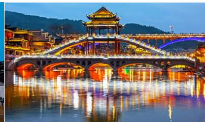
สะพานหงเจียว

วันที่สี่ เที่ยวชมเมืองโบราณฝูหรงเจิ้น-เดินทางสู่เมืองโบราณฟ่งหวง- เที่ยวชมย่านเมืองเก่าเมืองโบราณฟ่งหวง