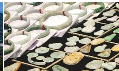
ศูนย์จำหน่ายผลิตภัณฑ์หยก

วันที่หก เมืองจางเจียเจี๋ย - เลือกซื้อโปรแกรมทัวร์เสริม(สะพานกระจกข้ามหุบเขาแกรนด์แคนยอน) – ร้านหยก- ร้านใบชา – เดินทางกลับเมืองหยีซัง