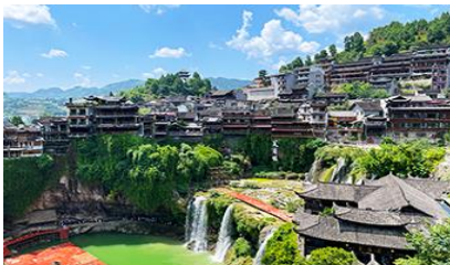
เมืองโบราณฝูหรงเจิ้น

เย็น รับประทานอาหารเช้า ณ ภัตตาคาร หลังอาหารเช้าชม เมืองโบราณฝูหรงเจิ้นยามราตรีที่ประดับประดาด้วยแสงสี ชมน้ำตกกลางเมืองโบราณท่ามกลางแสงไฟและเสียงดนตรี พร้อมชมการแสดงพื้นเมือง ณ ลานแสดงกลางแจ้ง (การแสดงจะมีเฉพาะวันที่อากาศดี ไม่มีฝน) จนครบแก่เวลา นำท่านเดินทางกลับโรงแรมที่พัก จากนั้นนำท่านกลับเข้าสู่ที่พักโรงแรม ห่างจากเมืองเก่าโบราณนั่งรถประมาณ 10 นาที พักที่ CHA XI TAI HOTEL 4* เมืองฝูหรงเจิ้น https://hk.trip.com/hotels/guzhang-hotel-detail-68614854/chaxitai-holiday-hotel/