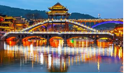
สะพานหวงเจียว