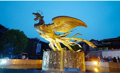
เมืองโบราณฟ่งหวง