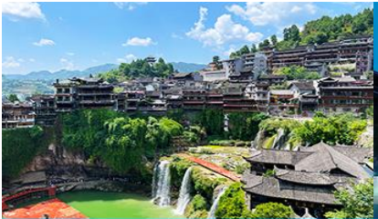
เมืองโบราณฝูหรงเจิ้น

เย็น รับประทานอาหารค่ำ ณ ภัตตาคาร หลังอาหารเช้าชมเมืองโบราณฝูหรงเจิ้นยามราตรีที่ประดับประดาด้วยแสงสี ชมน้ำตกกลางเมืองโบราณท่ามกลางแสงไฟและเสียงดนตรี พร้อมชมการแสดงพื้นเมือง ณ ลานแสดงกลางแจ้ง (การแสดงจะมีเฉพาะวันที่อากาศดี ไม่มีฝน) จนครบแคะเวลา นำท่านเดินทางกลับโรงแรมที่พัก จากนั้นนำท่านกลับเข้าสู่ที่พักโรงแรม ห่างจากเมืองเก่าโบราณนั่งรถประมาณ 10 นาที พักที่ CHA XI TAI HOTEL 4* เมืองฝูหรงเจิ้น https://hk.trip.com/hotels/guzhang-hotel-detail-68614854/chaxitai-holiday-hotel/