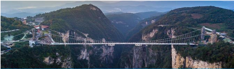
สะพานกระจกจางเจียเจีย

อัตราค่าบริการสำหรับโปรแกรมเสริมการแสดงชุด The love Story of Wooden man and Fairy Fox ท่านละ 400 หยวน (หรือ 2,000 บาทขึ้นอยู่กับอัตราแลกเปลี่ยน) ระยะเวลาที่ใช้ในการเที่ยวชมการแสดง ประมาณ 3 ชั่วโมง รวมเวลาเดินทางไป กลับค่าบริการรวม ค่าบัตรเข้าชม ค่ารถรับ ส่ง และค่าน้ำดื่มของไกด์ท้องถิ่นพักที่ GUIYUANZHENPIN HOTEL โรงแรมระดับ 4 ดาวหรือเทียบเท่า