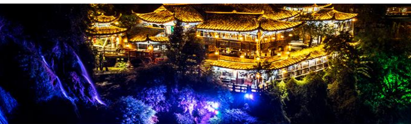
เมืองโบราณฟูหรงเจิน

วันที่สาม เมืองหยี่ซาง – เมืองจางเจียงเจี๋ย – ตึกมหัศจรรย์ 72 ชั้น-ศูนย์แพทย์แผนจีน – เมืองโบราณฟูหรงเจิน