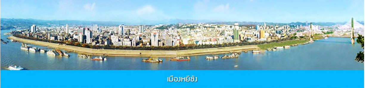
เมืองหยีซัง