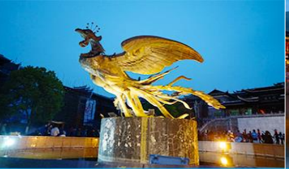
เมืองโบราณฟ่งหวง