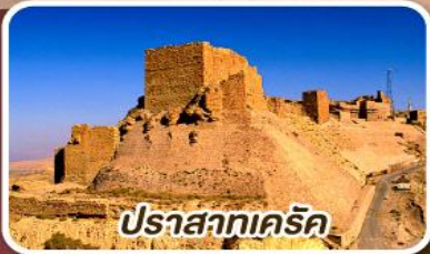
ปราสาทเคิร์ค