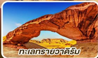
ทะเลทรายวาดีรัม