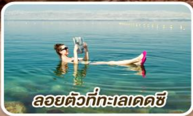
ลอยตัวที่ทะเลเดดซี