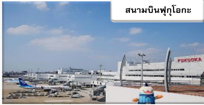
สนามบินฟูกูโอกะ

เวลา 07.05 น. เดินทางถึง สนามบินฟูกูโอกะ ประเทศญี่ปุ่น นำท่านผ่านขั้นตอนการตรวจคนเข้าเมืองและศุลกากร เวลาญี่ปุ่น เร็วกว่าประเทศไทย 2 ชั่วโมง