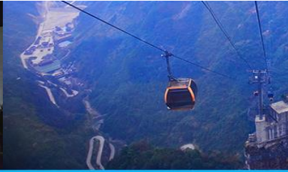
กระเช้าขึ้นเทียบเหมินซาน