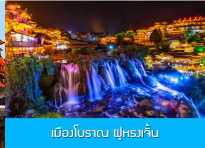
เมืองโบราณ ผู่หงเจิ้น

วันที่สาม เมืองจางเจียเจี๋ย-ออฟชั่นไกด์ขายสะพานกระจกข้ามเขาแกรนด์แคนยอน - ตึกมหัศจรรย์ 72 ชั้น นอนในเมืองเก่าโบราณผู่หงเจิ้น เต็มอิ่มแสงสี ยามค่ำคืน