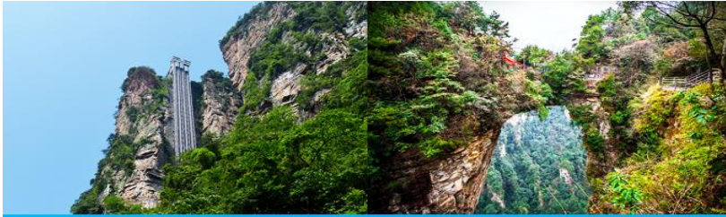
ลิฟท์แก้วไปหลง