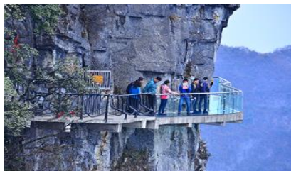
หน้าผาลอยฟ้าทางเดินกระจก