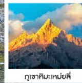
ภูเขาหิมะเหมย์ลี่

บินตรงลี่เจียง ✈️ 6 DAYS | 5 NIGHTS YADING Heaven on Earth ย่าติง • เต๋อชิง • แฉงกรีล่า