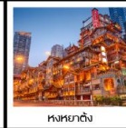
หงหยาดัง