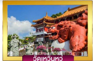
วัดเหวินหู

เดินทางโดยสายการบินไชน่าแอร์ไลน์ อาหาร : 8 มื้อ โรงแรม : 3-4 ดาว