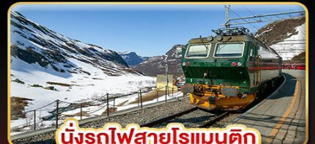
นั่งรถไฟสายโรแมนติก “พร้อมสปาณา”