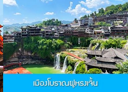
เมืองโบราณฝูหรงเก๋น

วันที่สาม ฉางเต๋อ-ฉางเจียเจี้ย-พิพิธภัณฑภาพหินทราย-ตึกมหัศจรรย์ 72 ชั้น – เมืองโบราณฝูหรงเจิน-ชมวิวยามค่ำคืนเมืองโบราณฝูหรงเจิน-นอนในเมืองเก่าฝูหรงเจิน