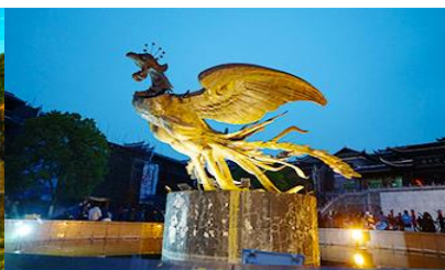
เมืองโบราณฟงหวง