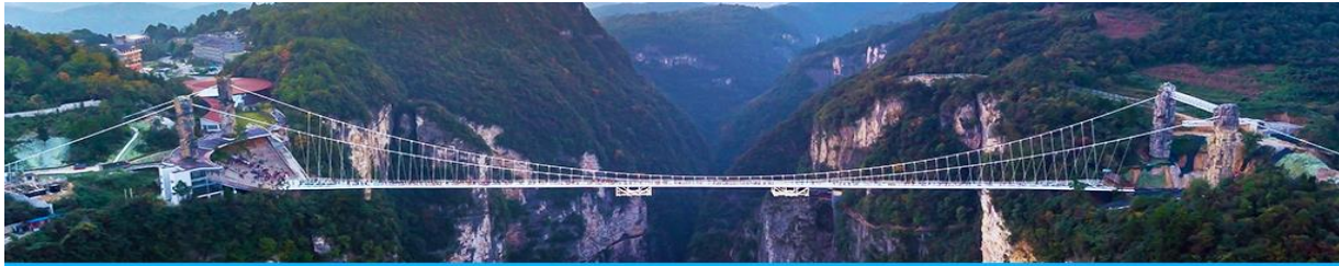
สะพานกระจกข้ามหุบเขาแกรนด์แคนยอน

หลังอาหารให้ท่านพักผ่อนตามอัชฌาศัย หรือ ท่านสามารถเลือกซื้อโปรแกรมเสริมซึ่งเป็นโปรแกรมท่องเที่ยวที่ไม่ได้รวมอยู่ในรายการท่องเที่ยว ได้แก่ โปรแกรมเที่ยวสะพานกระจกที่ถูกสร้างล้อมหุบเขาที่สูงที่สุดในโลก สะพานกระจกจางเจียเจีย (张家界大峡谷玻璃桥) ในเขตอุทยานแกรนด์แคนยอน ทำทนายท่านด้วยการเดินผ่าน สะพานพื้นกระจกใสที่มีความสูงจากพื้น 980 ฟุต โดยมีความยาวของสะพาน 400 เมตร สะพานที่น่าหวาดเสียวแห่งนี้ออกแบบ โดย Haim Dotan วิศวกรชาวอิสราเอล โดยต้องการสร้างสะพานกระจกเพื่อเชื่อมยอดเขาสองยอดเข้าไว้ด้วยกัน สามารถรองรับนักท่องเที่ยวได้คราวละ 800 คนพร้อมกัน สะพานนี้เป็นอีกหนึ่งไฮไลท์สำหรับผู้มาเยือนจางเจียเจีย