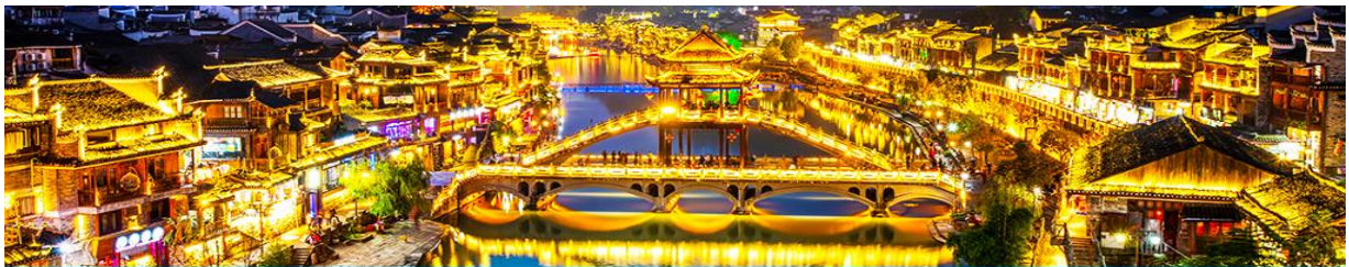
เมืองโบราณฟงหวง

จากนั้นนำท่านเดินทางสู่ เมืองโบราณฟงหวง (เมืองหงส์) 凤凰古城 ใช้เวลาเดินทางประมาณ 2 ชั่วโมง เมืองนี้ตั้งอยู่ในเขตปกครองตนเองของชนเผ่ากู่เจีย ตั้งอยู่ริมแม่น้ำถั่วเจียงทางทิศตะวันตกของมณฑลหูหนาน ล้อมรอบด้วยขุนเขาเสมือนค่านช่องแคบภูเขาฟงหวง ตั้งเด่นตระหง่านเสมือนป้อมปราการ ธารน้ำถั่วเจียงใสสะอาดราวน้ำบริสุทธิ์ที่ถูกคลื่นกลองจมองเห็นก้นลำธาร ชุมชนที่เป็นบ้านเรือนจีนโบราณแบบยกพื้นสูงเรียงรายกันริมแม่น้ำ ช่างเป็นทัศนียภาพที่สวยงามมีเสน่ห์ของเมืองโบราณฟงหวง ราวกับดินแดนมนูญย์ที่สร้างอยู่บนสวรรค์.. *** นำท่านนั่งรถเมล์ของเมืองโบราณฟงหวงเข้าสู่โรงแรมในเมืองเก่า * กระเป๋าสัมภาระรวมค่าพนักงานขนจากรถบัสไปโรงแรมแล้ว