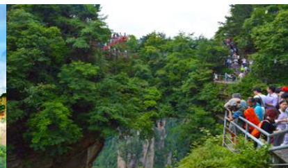
สะพานหนึ่งในไต้หล้า

วันที่หก จางเจี๋ยเจี๋ย-ฉิน-ลงลิฟท์แก้วเที่ยวเขาเทียนจื่อซาน-ภูเขาอวตาร-สะพานหนึ่งในไต้หล้า -ออฟชั่นะจก สะพานกระจกข้ามเขาแกรนด์แคนยอน