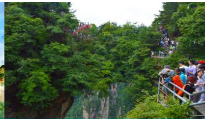
สะพานหนึ่งใบใต้หล้า