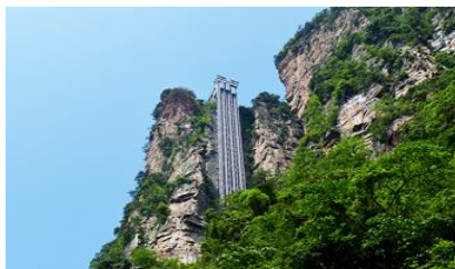
ลิฟท์แก้วไปหลง

หลังอาหารนำท่านเดินทางเข้าที่พัก หรือท่านสามารถเลือกซื้อโปรแกรมเสริม เป็นบัตรชมการแสดง ชุด The Love Story of a Wooden man and Fairy fox หรือที่เรียกกันในหมู่นักท่องเที่ยวไทยว่า โชว์จิ้งจอกขาว เป็นการแสดงกลางแจ้งที่ทุ่มทุนสร้างอย่างสุดอลังการ เป็นการแสดงที่น่าดูชมที่สุดในเมืองจางเจี๋ยเจี๋ย การแสดงชุดนี้ใช้ภูเขาประติมากรรมเป็นฉากหลังประกอบการแสดง ซึ่งให้ความรู้สึกสมจริงเสมือนผู้ชมและนักแสดงอยู่ท่ามกลางธรรมชาติ ใช้ทีมงานนักแสดงหลายร้อยคน และระบบแสง สี เสียงที่ทันสมัยประกอบการแสดง อัตราค่าบริการสำหรับโปรแกรมเสริมการแสดงชุด The love Story of Wooden man and Fairy Fox ท่านละ 400 หยวน (หรือ 2,000 บาทขึ้นอยู่กับอัตราแลกเปลี่ยน) ระยะเวลาที่ใช้ในการเที่ยวชมการแสดง ประมาณ 3 ชั่วโมง รวมเวลาเดินทางไป กลับค่าบริการรวม ค่าบัตรเข้าชม ค่ารถรับ ส่ง และค่าน้ำเที่ยวของไกด์ท้องถิ่น พักที่ ZHENMIAN HOTEL โรงแรมระดับ 4 ดาวหรือเทียบเท่าจางเจี๋ยเจี๋ย