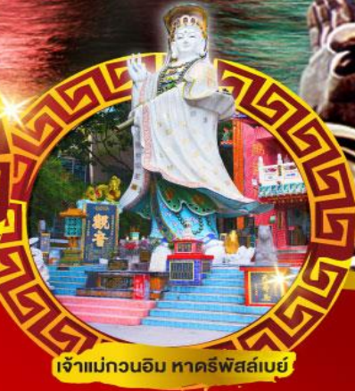
เจ้าแม่กวนอิม หาดริฟส์เบย์