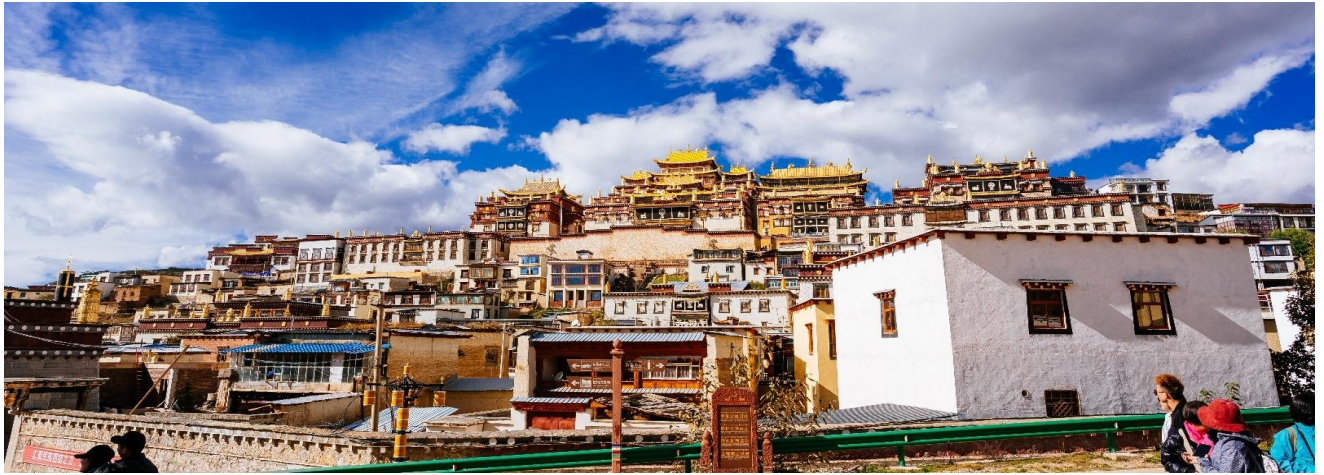
นำชม เมืองโบราณแซงกริล่า เป็นศูนย์รวมของวัฒนธรรมชาวทิเบตลักษณะคล้ายชุมชนเมืองโบราณทิเบต ซึ่งเต็มไปด้วยร้านค้าของคนพื้นเมืองและร้านขายสินค้าที่ระลึกมากมาย