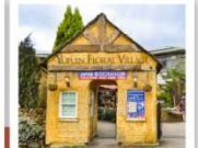
ยูฟุอิน ฟลอร์รัล