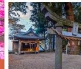
ศาลเจ้าคามิซึกิ

หมู่บ้านยูฟุอินฟลอร์รัล / สวนดอกไม้คุ จุดชมวิวดาคังโบ / ศาลเจ้าคามิซึกิ คามาโนะฮิเมะสึ ทุ่งหญ้าคุสะเซนริ / โทสุ พรีเมียม เอ้าท์เล็ท