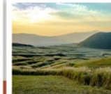
ทุ่งหญ้าคุสะเซนริ