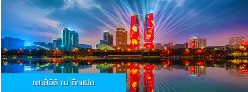
แสลส์มีดึ ดึ ตึกเฟด