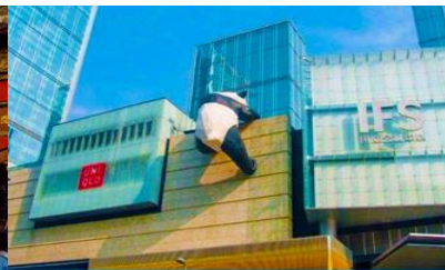
หมึแพนด้าปึนตึก ดึ ตึก IFS