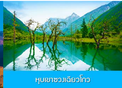
หุบเขาชวงเจียวโกว