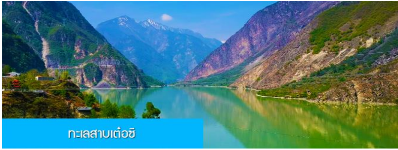
ทะเลสาบเต๋อซี