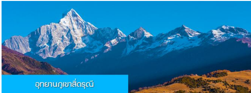
อุทยานภูเขาเสีครุณี

หลังอาหารเช้าท่านเที่ยวชม หุบเขาชวงเจียวโกว 双桥沟景区 ที่เป็นแหล่งท่องเที่ยวที่สวยงามที่สุดแห่งหนึ่งในเขตอุทยานภูเขาเสีครุณี นำท่านนั่งรถบัสของอุทยานที่วิ่งไปผ่านเส้นทางทที่สร้างคู่ขนานกับลำธารกสยในหุบเขา ท่านจะได้สัมผัสกับความสวยงามของทัศนียภาพธรรมชาติที่หาชมได้ยาก โดยมีภูเขาหิมะสูงตระหง่านอยู่เบื้องหลัง ธารน้ำใสไหลริน และสระน้ำที่มีสีเขียวมรกต ในฤดูใบไม้ผลิและฤดูร้อนท่านจะได้เห็นฝูงจามรีท่ามกลางทุ่งหญ้าเขียวขจี ส่วนในฤดูหนาวทุ่งหญ้าและพื้นดินจะปกคลุมด้วยพรมหิมะสีขาว...รถบัสของอุทยานจะนำนักท่องเที่ยวไปยังจุดชมวิิวสำคัญต่าง ๆ ภายในเขตอุทยาน เพื่อให้นักท่องเที่ยวได้เที่ยวชมสถานที่และถ่ายรูปตามอัธยาศัย จนครบแ่เวลา นำคณะขึ้นรถบัสออกจากอุทยาน