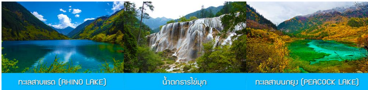
ทะเลสาบไธส (RHINO LAKE)

หลังอาหารเช้าท่านเดินทางสู่ อุทยานแห่งชาติจิวจ้ายโกว 九寨沟景区 ตั้งอยู่ด้านทิศเหนือของมณฑลเสฉวน ซึ่งเป็นส่วนหนึ่งในบริเวณตอนใต้ของเทือกเขาหิมิงซาน ห่างออกไปจากตัวเมืองเฉิงตูราว 500 กิโลเมตร จิวจ้ายโกวมีชื่อเสียงด้านความงามแห่งสีสันที่แปลกเปลี่ยนไม่รู้จบ ทะเลสาบผุดขึ้นท่ามกลางหมู่เมฆไม้เขียวขจี น้ำใสเป็นประกายชุ่มฉ่ำ ยอดเขาหิมะตัดกับท้องฟ้าสีคราม เกิดเป็นภาพธรรมชาติอันงดงามที่แปรเปลี่ยนไปตามฤดูกาลผลิ ด้วยความสวยงามจึงทำให้อุทยานแห่งชาติจิวจ้ายโกว ได้ถูกขึ้นทะเบียนเป็นมรดกโลกทางธรรมชาติในปีค.ศ. 1992