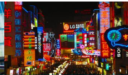
ถนนคนเดินชุนชี่ดู๋