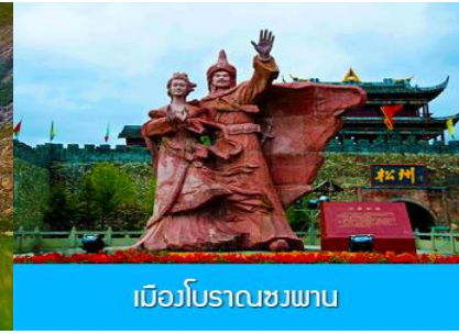
เมิวโบราณชงพาน