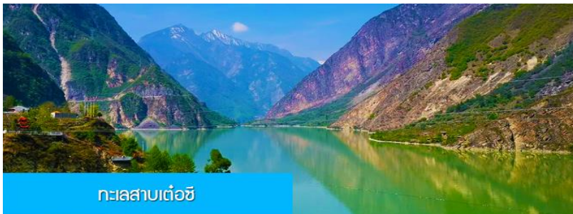
ทะเลสาบเต๋อซี

พักที่ MINJIANG HOTEL 5* หรือ โรงแรมระดับ 5 ดาวท้องถิ่น