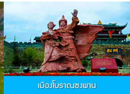
เบียวโบราณชวงพาน

วันที่ 1 เมืองชวนจู๋ซือ – ทะเลสาบเต๋อซี-อุทยานภูเขาสี่ครุณี-ผ่านชมวิวกุเขาที่ราบสูง