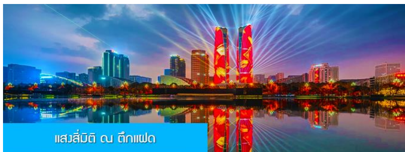
แสล่บีบี ซี ตึกแฝด