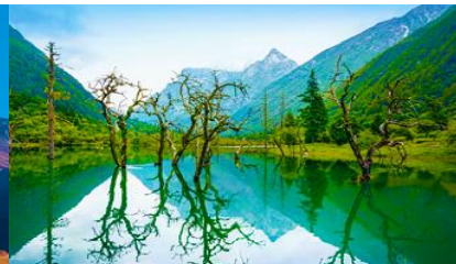
หุบเขาชวงเฉียวโกว