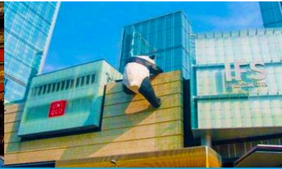
หมีแพนด้าปับติก ณ ตึก IFS