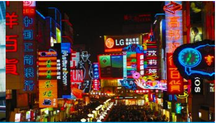
ถนนคนเดินชุนชี่