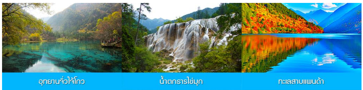
อุทยานจิวจ้ายโกว น้ำตกธารไข่มุก ทะเลสาบแฟนต้า

ค่ำ รับประทานอาหารค่ำ ณ ภัตตาคาร พักที่ โรงแรม JIUYUAN HOTEL ระดับ 4 ดาวท้องถิ่นหรือเทียบเท่าในอุทยานจิวจ้ายโกว