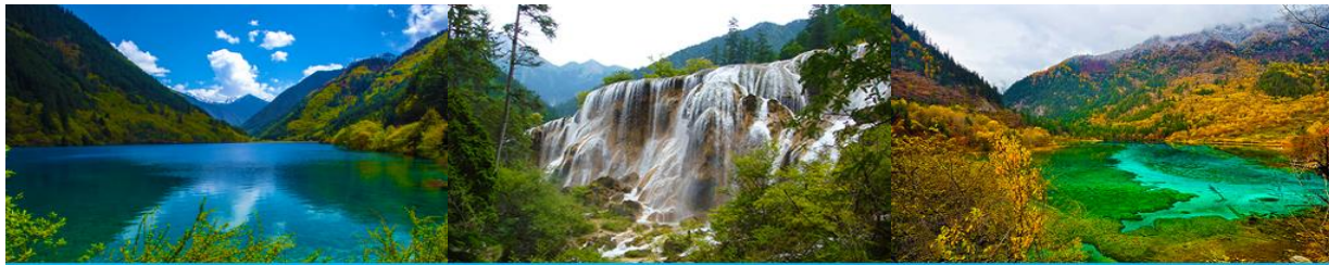
ทะเลสาบแรด (RHINO LAKE)

หลังอาหารเช้าท่านเดินทางสู่ อุทยานแห่งชาติจิวจ้ายโกว 九寨沟景区 ตั้งอยู่ด้านทิศเหนือของมณฑลเสฉวน ซึ่งเป็นส่วนหนึ่งในบริเวณตอนใต้ของเทือกเขาหิมิงซาน ห่างออกไปจากตัวเมืองเจียงซูราว 500 กิโลเมตร จิวจ้ายโกวมีชื่อเสียงด้านความงามแห่งสีสันที่แปลกเปลี่ยนไม่รู้จบ ทะเลสาบผุดขึ้นท่ามกลางหมอกเมฆไม้เขียวขจี น้ำใสเป็นประกายชุ่มฉ่ำ ยอดเขาหิมะตัดกับท้องฟ้าสีคราม เกิดเป็นภาพธรรมชาติอันงดงามที่แปรเปลี่ยนไปตามฤดูกาลผลิ ด้วยความสวยงามจึงทำให้อุทยานแห่งชาติจิวจ้ายโกว ได้ถูกขึ้นทะเบียนเป็นมรดกโลกทางธรรมชาติ ในปีค.ศ. 1992