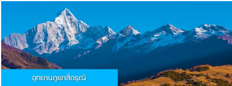
อุทยานภูเขาสี่ครุณี

หลังอาหารนำท่านเที่ยวชม หุบเขาชวงเฉียวโกว 双桥沟景区 ที่เป็นแหล่งท่องเที่ยวที่สวยงามที่สุดแห่งหนึ่งในเขตอุทยานภูเขาสี่ครุณี นำท่านนั่งรถบัสของอุทยานที่วิ่งไปผ่านเส้นทางที่สร้างคู่ขนานกับลำธารกษยในหุบเขา ท่านจะได้สัมผัสกับความสวยงามของทัศนียภาพธรรมชาติที่หาชมได้ยาก โดยมีภูเขาหิมะสูงตระหง่านอยู่เบื้องหลัง ธารน้ำใสไหลริน และสระน้ำที่มีสีเขียวมรกต ในฤดูใบไม้ผลิและฤดูร้อนท่านจะได้เห็นฝูงจามรีท่ามกลางทุ่งหญ้าเขียวจี ส่วนในฤดูหนาวทุ่งหญ้าและพื้นดินจะปกคลุมด้วยพรมหิมะสีขาว....รถบัสของอุทยานจะนำนักท่องเที่ยวไปยังจุดชมวิวลสำคัญต่าง ๆ ภายในเขตอุทยาน เพื่อให้นักท่องเที่ยวได้เห็นที่วิวชมสถานที่และถ่ายรูปตามอัธยาศัย จนครบแ่เวลา นำคณะขึ้นรถบัสออกจากอุทยาน