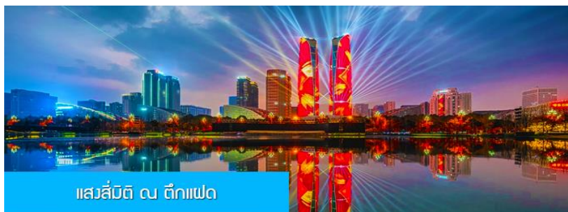
แสวงสี่มิติ ณ ตึกแฝด