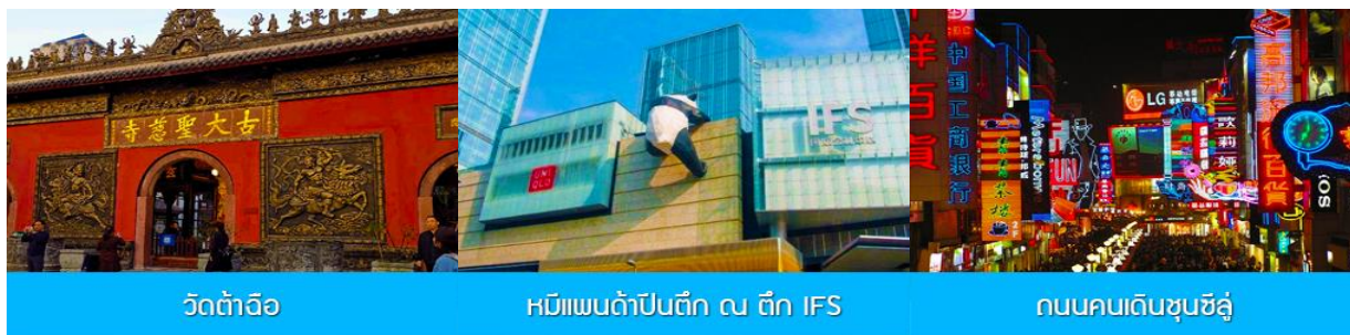
วัดต้าเจี๊ว