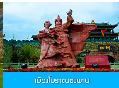
เบียวโบราณชงพาน