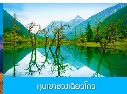
หุบเขาชวงเฉียวโกว