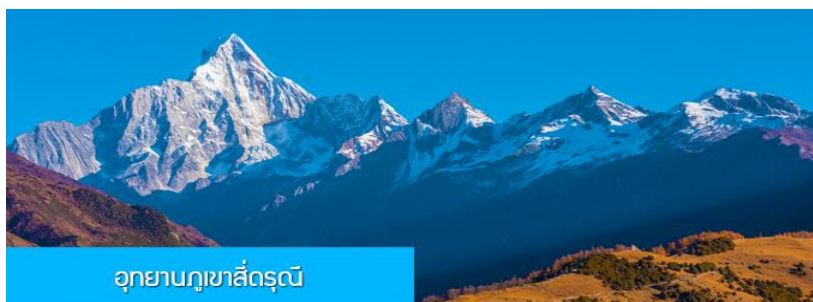
อุทยานภูเขาสี่ครุณี

หลังอาหารนำท่านเที่ยวชม หุบเขาชวงเฉียวโกว 双桥沟景区 ที่เป็นแหล่งท่องเที่ยวที่สวยงามที่สุดแห่งหนึ่งในเขตอุทยานภูเขาสี่ครุณี นำท่านนั่งรถบัสของอุทยานที่วิ่งไปผ่านเส้นทางที่สร้างคู่ขนานกับลำธารกษยในหุบเขา ท่านจะได้สัมผัสกับความสวยงามของทัศนียภาพธรรมชาติที่หาชมได้ยาก โดยมีภูเขาหิมะสูงตระหง่านอยู่เบื้องหลัง ธารน้ำใสไหลริน และสระน้ำที่มีสีเขียวมรกต ในฤดูใบไม้ผลิและฤดูร้อนท่านจะได้เห็นฝูงจามรีท่ามกลางทุ่งหญ้าเขียวจี ส่วนในฤดูหนาวทุ่งหญ้าและพื้นดินจะปกคลุมด้วยพรมหิมะสีขาว....รถบัสของอุทยานจะนำนักท่องเที่ยวไปยังจุดชมวิวลสำคัญต่าง ๆ ภายในเขตอุทยาน เพื่อให้นักท่องเที่ยวได้เห็นที่วิวสถานที่และถ่ายรูปตามอัธยาศัย จนครบแ่เวลา นำคณะขึ้นรถบัสออกจากอุทยาน