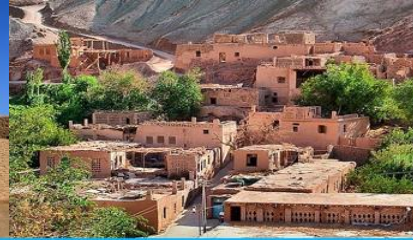
หมู่บ้านอูยгур์