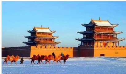
ด่านเจียชวี่กวน

พักที่ REZEN HOTEL ระดับ 4 ดาวห้องดีนหรือเทียบเท่าในเมือง เจียชวี่กวน