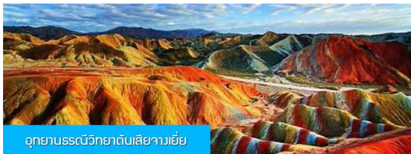
อุทยานธรณีวิทยาตันเสี่ยจางเยี่ย

พักที่ JIN WU INTER HOTEL โรงแรมระดับ 4 ดาวห้องดีน หรือเทียบเท่าในเมืองหวู่เว่ย