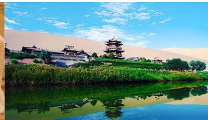
สระน้ำวังพระจันทร์