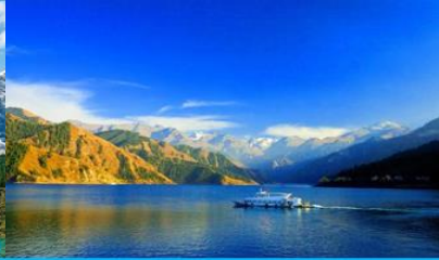
ล่องเรือทะเลสาบเทียนฉือ