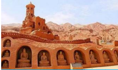
ถ้ำพระพันองค์

พักที่ HAMPTON BY HILTON HOTEL โรงแรมระดับ 4 ดาวหรือเทียบเท่าในเมืองอู่หลู่ฟาน