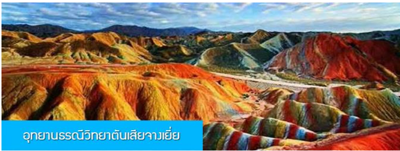
อุทยานธรณีวิทยาตันเสี่ยจางเยี่ย

พักที่ JIN WU INTER HOTEL โรงแรมระดับ 4 ดาวห้องดีน หรือเทียบเท่าในเมืองหู่เว่ย