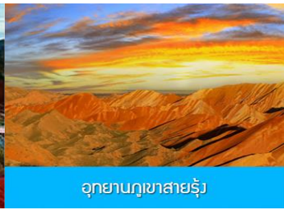
อุทยานภูเขาสายรุ้ง