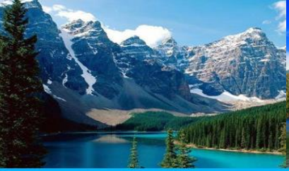
ภูเขาเทียนชาน

พักที่ HAMPTON BY HILTON URUMQI HOTEL โรงแรมระดับ 4 ดาวหรือเทียบเท่าในเมืองอูรูมฉี