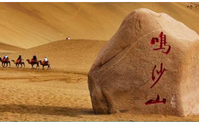
เนินทรายหมิงซาซาน