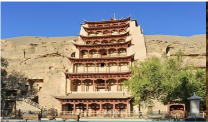
ถ้ำหินมั่วเกาคุ

พักที่ METRO PARK HOTEL โรงแรมระดับ 4 ดาวหรือเทียบเท่าในเมืองคุนหวง