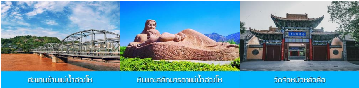
สะพานข้ามแม่น้ำฮวงโห