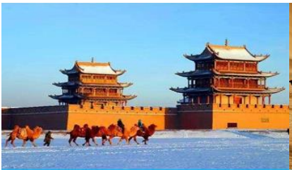
ด่านเจียชวี่กวน

พักที่ REZEN HOTEL ระดับ 4 ดาวห้องดีนหรือเทียบเท่าในเมือง เจียชวี่กวน