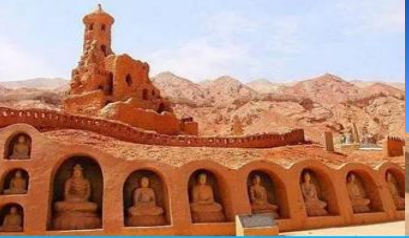
ถ้ำพระพันองค์

พักที่ HAMPTON BY HILTON HOTEL โรงแรมระดับ 4 ดาวหรือเทียบเท่าในเมืองอู่หลู่ฟาน