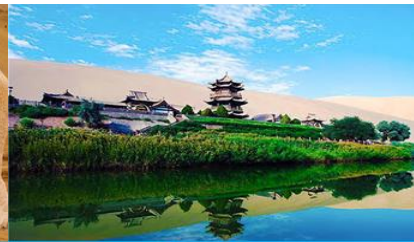
สระน้ำวพระจันทร์