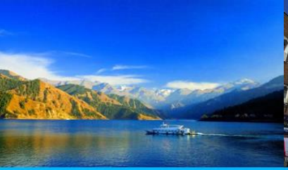
ล่องเรือทะเลสาบเทียนฉือ