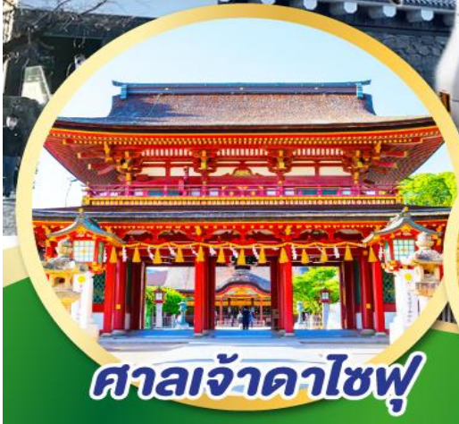
ศาลเจ้าดาไซฟุ

พักในฟุกุโอกะ 2 คืน พักออนเซ็น 1 คืน พร้อมอาหารเช้า