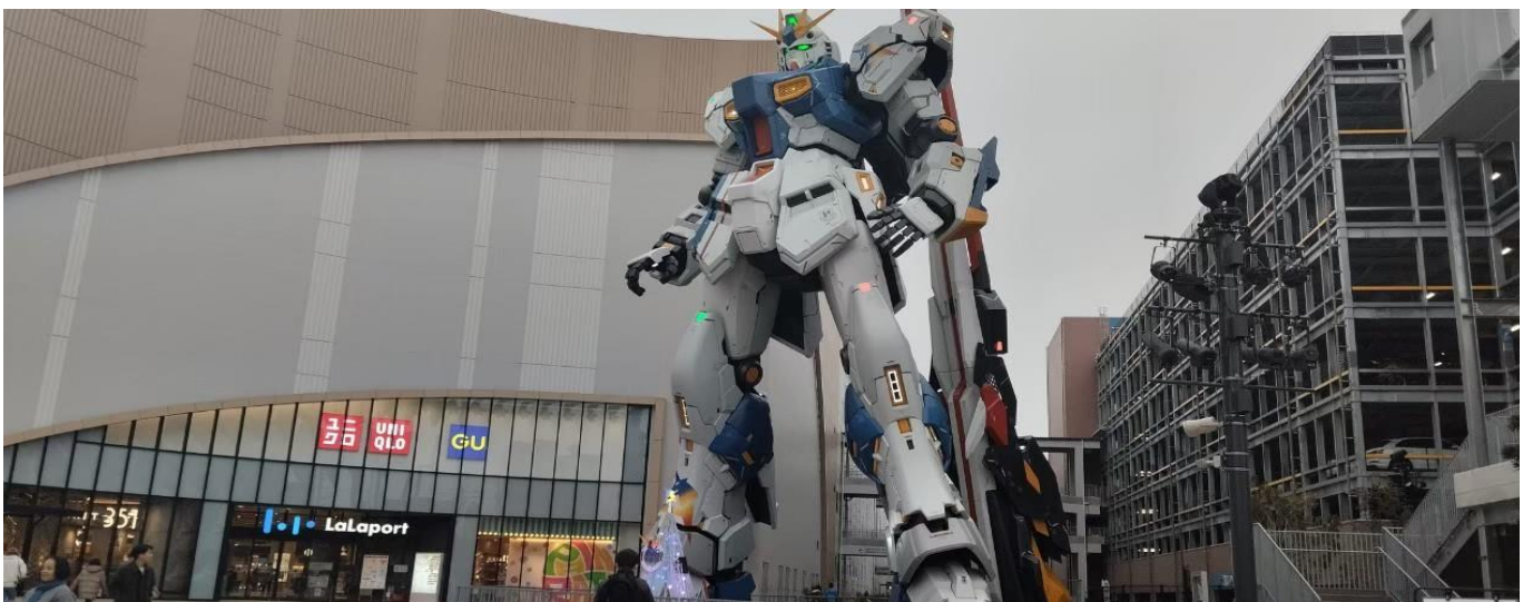
GO2FUK-VZ001 – KYUSHU BEPPU KUMAMOTO 5D3N VZ

นำท่านเดินทางสู่ กันดั้ม ปาร์ค ฟุกุโอกะ (Gundam Park Fukuoka) ไฮไลท์!!! ชม กันดั้มตัวใหม่ล่าสุด ขนาดเท่าของจริง “Nu Gundam” และยังถูกประกาศว่าเป็นกันดั้มที่สูงที่สุดในญี่ปุ่น มีการระบุดความสูงประมาณ 20 เมตร ซึ่งสูงกว่า RX-0 Unicorn Gundam ในโตเกียวที่สูง 19.7 เมตร และสูงกว่า RX-78-2 Gundam ในโยโกฮาม่าที่สูง 18 เมตร โดย NU Gundam ปรากฏตัวในภาพยนตร์เรื่อง Mobile Suit Gundam Char’s Counter Attack ที่ฉายในปีค.ศ.1988 ถึงจะผ่านมามากกว่า 30 ปีแต่ยังคงเป็นที่รักและที่นิยม ของแฟน ๆ กันดั้มทั่วโลก ตั้งอยู่ที่ ศูนย์การค้า Mitsui Shopping Park Lalaport Fukuoka ในฟุกุโอกะ เปิดตัวครั้งแรกเมื่อวันที่ 25 เมษายน ค.ศ.2022 ถือเป็นแลนด์มาร์คแห่งใหม่ ที่ใครมาเยือนฟุกุโอกะไม่ควรพลาด ให้ท่านได้เพลิดเพลินกับการถ่ายรูปเก็บความประทับใจ ซื้อสินค้าที่ระลึกตามอัธยาศัย