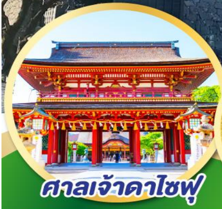
ศาลเจ้าดาไซฟุ