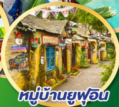
หมู่บ้านยูฟูอิน