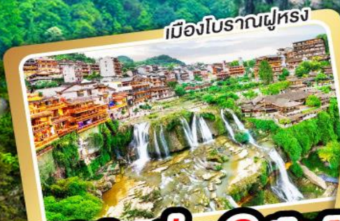
เมืองโบราณฝูหลง