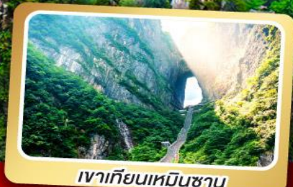
เวาเทียนเหมินชาน

ทริปเดียวเที่ยว 2 เมืองโบราณ ฝูหลงและเฟิ่งหวง ลัมรส สุกี้เด็ด บั๊อย่างเกาหลี เปิดปิกกิ้ง