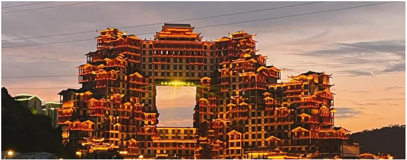
ที่พัก COUNTRY GARDEN PHOENIX HOTEL หรือเทียบเท่าระดับ 5 ดาว (มาตรฐานประเทศจีน)

วันที่สี่ เมืองโบราณฟุหรงเจิน – น้ำตกฟุหรงเจิน – เมืองโบราณเฟิงหวง – บ้านเกิดกวีเสินจงเหวิน – ล่องเรือแม่น้ำถั่วเจียง – สะพานสายรุ้ง