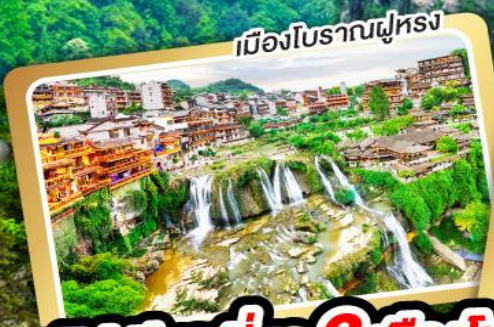
เมืองโบราณฝูหลง