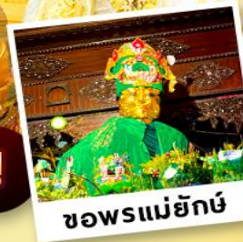
ซอพรแม่ยักย์