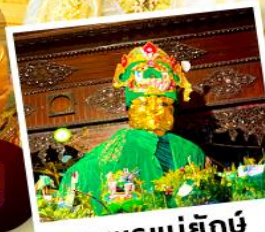
ซอพรแม่ยักย์