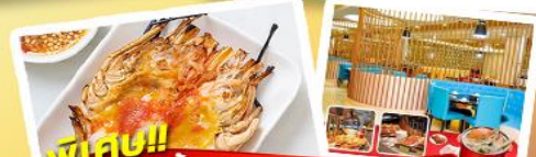
พิกซ!! ก๊วยแม่น้ำ + HOTPOT SEAFOOD