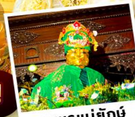
ซอพรแม่ยักย์