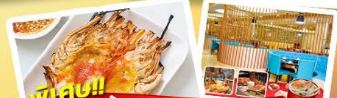
พริก!! ก๊วยแม่น้ำ + HOTPOT SEAFOOD