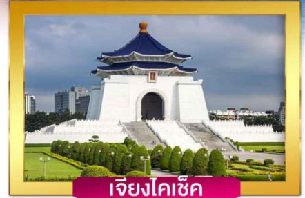
เจียงไคเช็ค