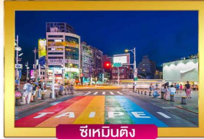
ซีเหมินติง