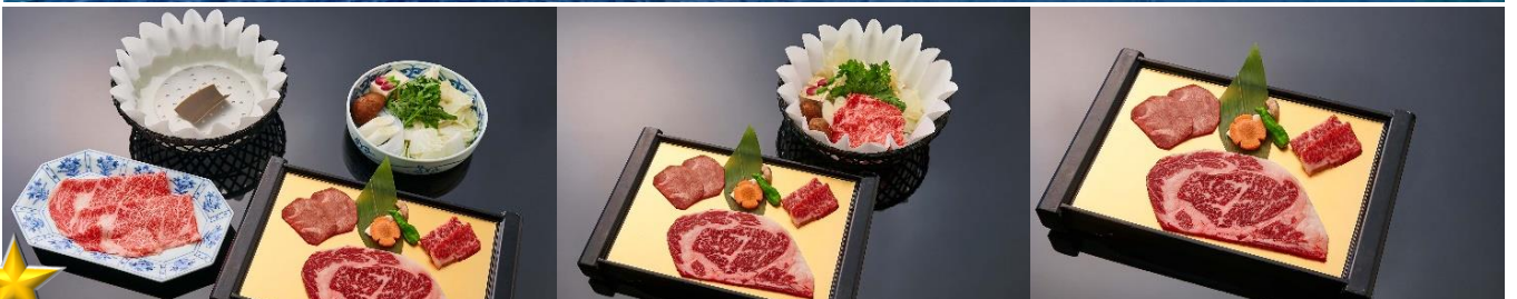
ROKKASEN มื้อพิเศษกับบุฟเฟ่ต์ปิ้งย่างพรีเมียม พร้อม SOFT DRINK แบบไม่อั้น!!!