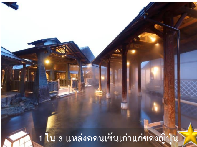
1 ใน 3 แหล่งออนเซ็นเก่าแก่ของญี่ปุ่น