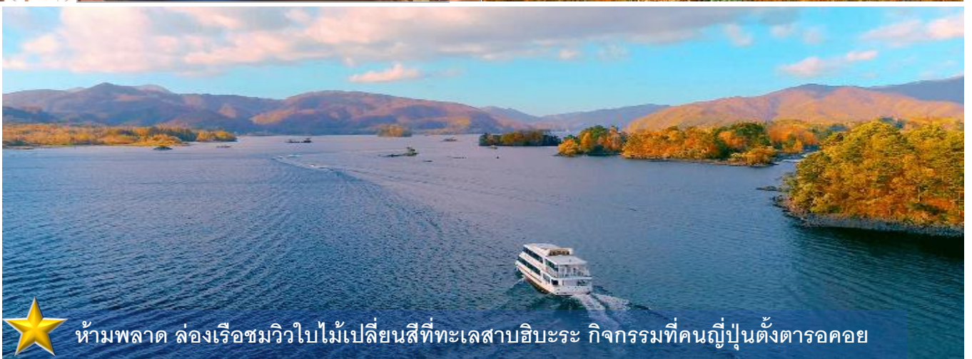
ห้ามพลาด ล่องเรือชมวิวน้ำเปลี่ยนสีที่ทะเลสาบฮิโระ กิจกรรมที่คนญี่ปุ่นตั้งตารอคอย