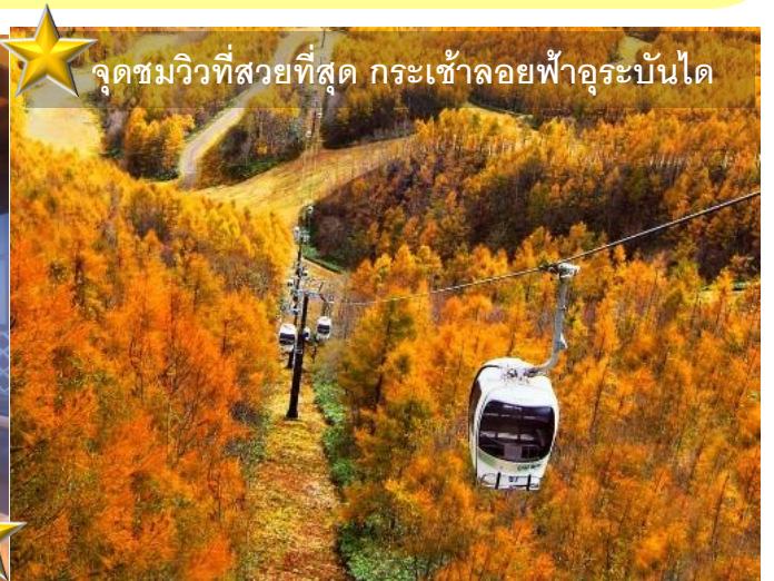
จุดชมวิวที่สวยงามที่สุด กระเช้าลอยฟ้าอูระบันได