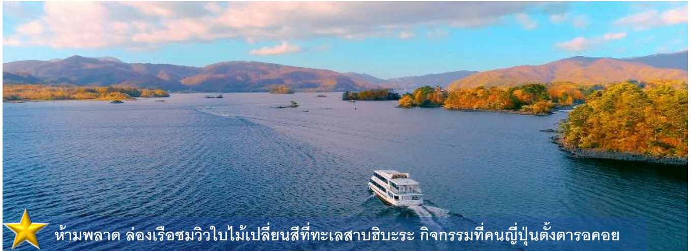
ห้ามพลาด ล่องเรือชมวิวยิบูไม้เปลี่ยนสีที่ทะเลสาบฮิบะระ กิจกรรมที่คนญี่ปุ่นตั้งตารอคอย