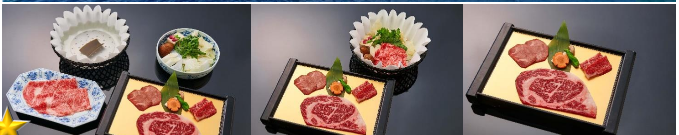
ROKKASEN มื้อพิเศษกับบุฟเฟ่ต์ปิ้งย่างพรีเมียม พร้อม SOFT DRINK แบบไม่อั้น!!!