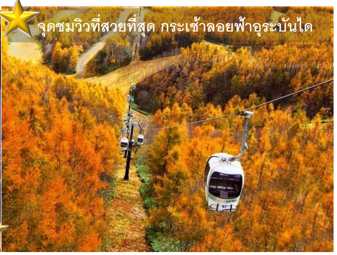
จุดชมวิวที่สวยงามที่สุด กระเช้าลอยฟ้าอุระบันได