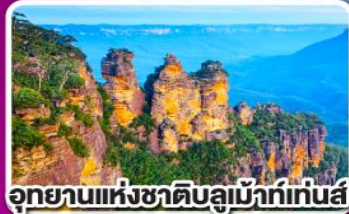
อุทยานแห่งชาติบลูแม้าท์เทนส์

พิเศษ เมนูกล่องลิบส์เตอร์ท่านละ 1 ตัว พร้อมไวน์ชั้นเยี่ยม