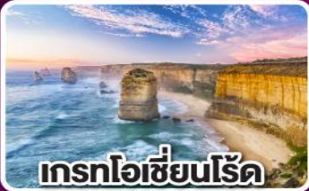
เกรทโอเซียนโรด