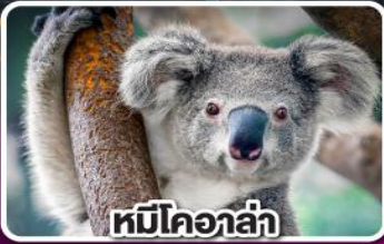
หมีโคอล่า