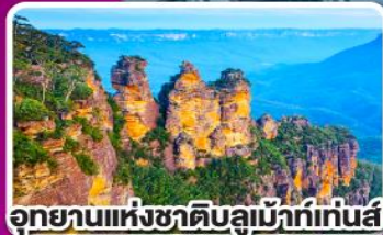
อุทยานแห่งชาติบลูแมกแท่นส์