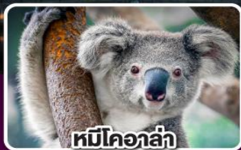
หมีโคอล่า