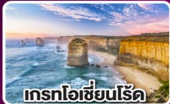
เกรทโอเชียนโรด