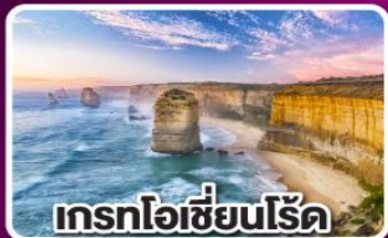
เกรทโอเซียนโรด