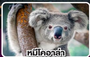
หมีโคอาล่า