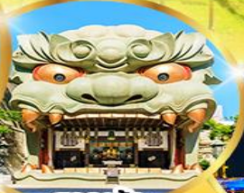
ศาลเจ้า นัมมะ ยาชากะ