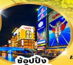
ช้อปปิ้ง ชินโซบาช

อิสระท่องเที่ยว 1 วันเต็ม วันอิสระเลือกซื้อ "Universal studio"