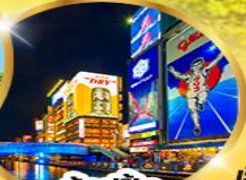
ช้อปปิ้ง ชินไซบาสึ