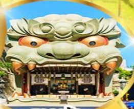
ศาลเจ้า นัมมะ ยาชากะ