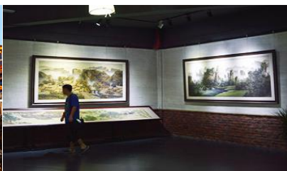
พิพิธภัณฑ์ภาพหินทราย