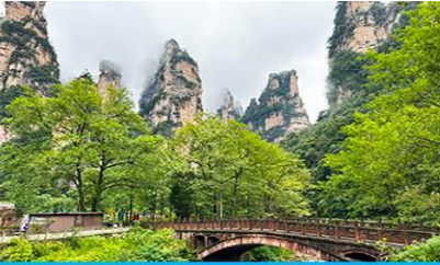
จุดชมวิวจินเปียนซี