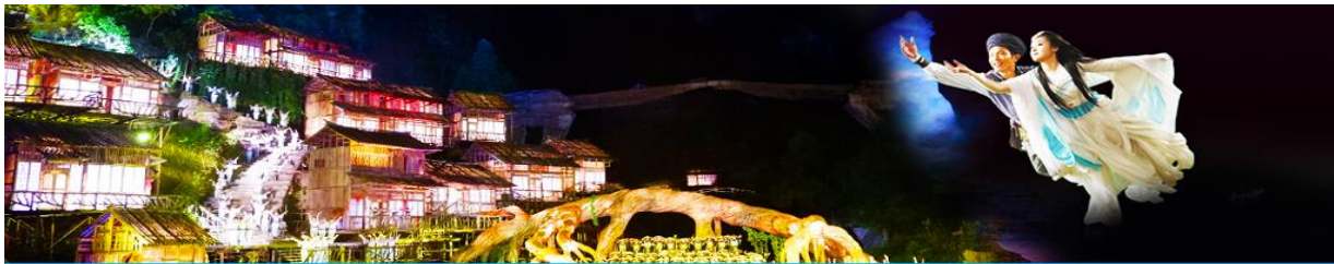
The Love Story of a Wooden Man and Fairy fox

จากนั้นท่านสามารถทดสอบกำลังขาของท่านโดยการเดินลงบันได 999 ขั้น เพื่อลงมายังลานกว้างที่เป็นจุดถ่ายรูปด้านล่างของประตูสวรรค์ ท่านที่ไม่ต้องการเดินบันไดลง สามารถใช้บันไดเลื่อนแทนการเดินลงบันได 999 ขั้น ณ ลานกว้างด้านล่างเป็นจุดถ่ายรูปที่ดีที่สุดที่สามารถมองเห็นเขาประตูสวรรค์ได้อย่างชัดเจน จากนั้นนำท่านนั่งกระเช้าลงจากเขาเทียนเหมินซาน