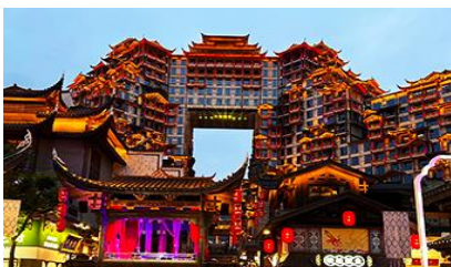
ตึกมหิศวรรษย์ 72 ชั้น

พักที่ CHANGDE YUNXI HOTEL ระดับ 4 ดาวท้องถิ่น หรือเทียบเท่าในเมืองฉางเต๋อ