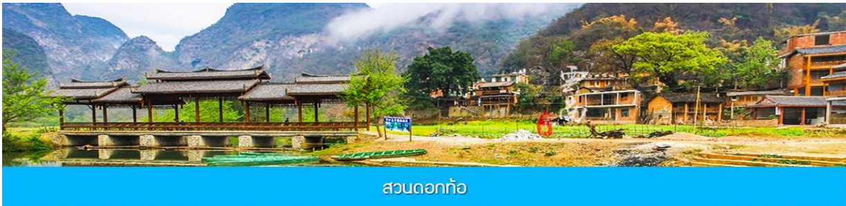
สวนดอกท้อ