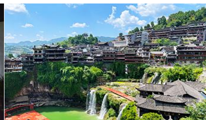
เมืองโบราณผู่หงกั้น