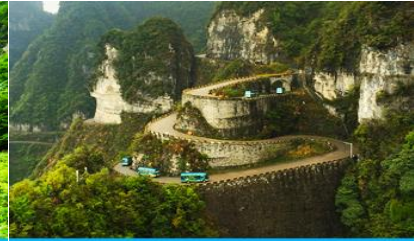
เส้นทาง 99 โค้ง