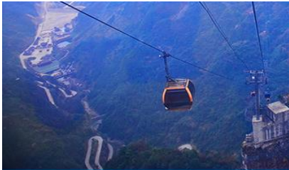
กระเช้าขึ้นเทียนเหมินซาน

https://hk.trip.com/hotels/guzhang-hotel-detail-68614854/chaxitai-holiday-hotel/