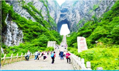
บันได 999 ขั้น