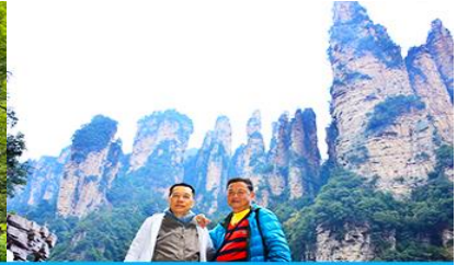
ชมจุดชมวิวลีฟท์แก้ว

วันที่ห้า เมืองจางเจียเจีย – เลือกซื้อโปรแกรมทัวร์เสริมออฟชั่น อุทยานอวตารจุดชมวิวจินเปียนซี-ชมจุดชมวิวลีฟท์แก้ว - ร้านหยก-ร้านใบชา-เดินทางกลับเมืองหยีซัง