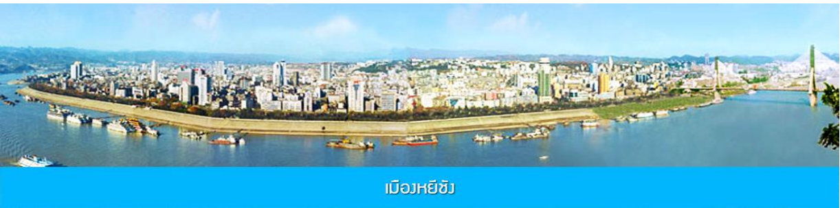
เมืองหยี่ซัง

- ไปรุ่งใส่น้ำเชื้อถือ ไม่มีค่าใช้จ่ายซ่อนเร้น ขายออฟชั่น 1. จุดชมวิวยุทธยานอวตาร, และ ชมชมลพที่แก้วไปหลง 2. โชว์จิ้งจอกขาว โปรอ่านรายละเอียดในโปรแกรม