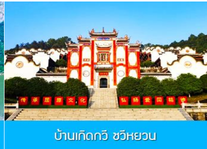
บ้านเกิดกวี ชวีหยวน