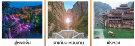
ฟูหลงจิน