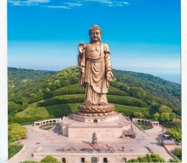
พระใหญ่หลิงซาน