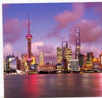
ขึ้นหอไข่มุก