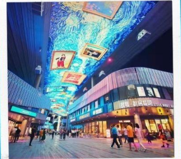
จัตุรัสหยวนหลง