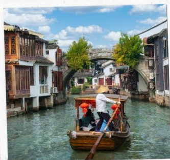
ล่องเรือจูเจียเจียว