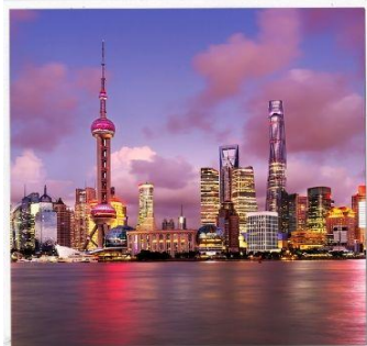
หอไข่มุก