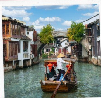
ล่องเรือจูเจียเจียว