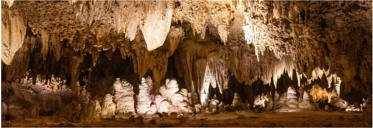
ถ้ำ รับประทานอาหารค่ำ ณ ภัตตาคารไทย

ภายในถ้ำมีหินปูนที่สวยงามมากมาย ทั้งหินงอก หินย้อย ถ้ำแห่งนี้ได้รับการประกาศเป็นอุทยานแห่งชาติใน ค.ศ. 1930 เนื้อที่รวมทั้งหมดกว่า 189 ตารางกิโลเมตร ได้เวลาอันสมควรนำท่านเดินทางสู่เมืองคาร์ลสแบด (Carlsbad) เป็นเมืองในและเป็นที่ตั้งของเทศมณฑลเอ็ดดีเคาน์ตี นิวเม็กซิโก สหรัฐอเมริกา